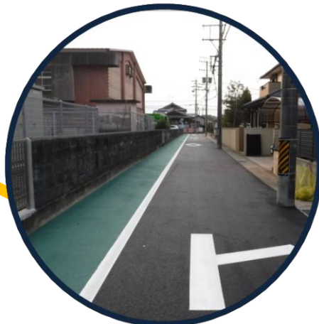
工事後の舗装工事を行います