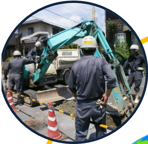
道路の掘削を行います