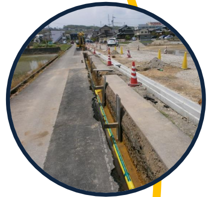
道路の地中にガス管を配管します